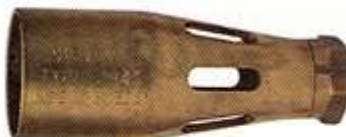
2943 Ø 35 mm, 2 bares 2000 g/h, 26 kW 4 bares 3350 g/h, 43.5 kW