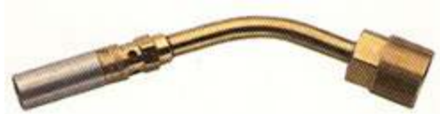
3537 \varnothing 9 mm, 15 g/h, 0.2 kW

Tubos de cuello sievert de latón de alta calidad hecho para durar. Conexión al mango BSP 3/8 " y Conexión M20x1 para los sopletes.