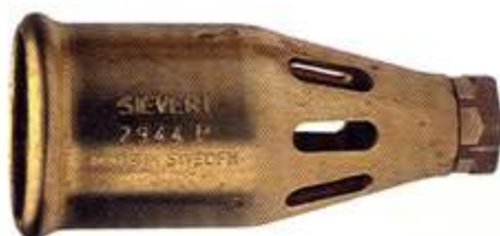
2944 Ø 50 mm, 2 bares 4000 g/h, 51.5 kW 4 bares 6700 g/h, 86 kW

Sopletes de Gran capacidad para trabajos que exigen calor. Idóneos para techar, trabajos de carreteras, etc. las llamas están muy bien protegidas del viento para asegurar un uso eficaz en el exterior, incluso en las malas condiciones atmosféricas.