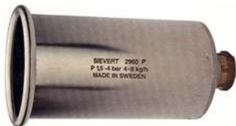
2960 Ø 60 mm, 2 bares 5300 g/h, 68.2 kW 4 bares 8250 g/h, 114 kW

2960 Soplete de Gran Potencia. Muy bien protegido contra el viento para su uso en el exterior, incluso en las peores condiciones atmosféricas.