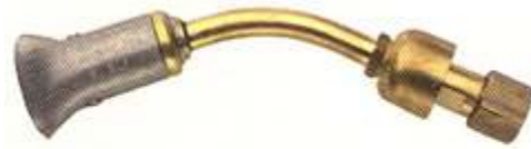
3517 40x8 mm, 210 g/h, 2.7 kW